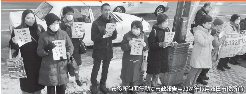
市役所包囲行動で市政報告＝2024年12月25日市役所前

札幌市は、存続・充実を求める55,000人以上の署名に背を向け、敬老優待乗車証（敬老パス）制度を縮小しようとしています。不要不急の事業にメスを入れて、福祉や子育て施策を充実してほしいという市民の意思に反しています。